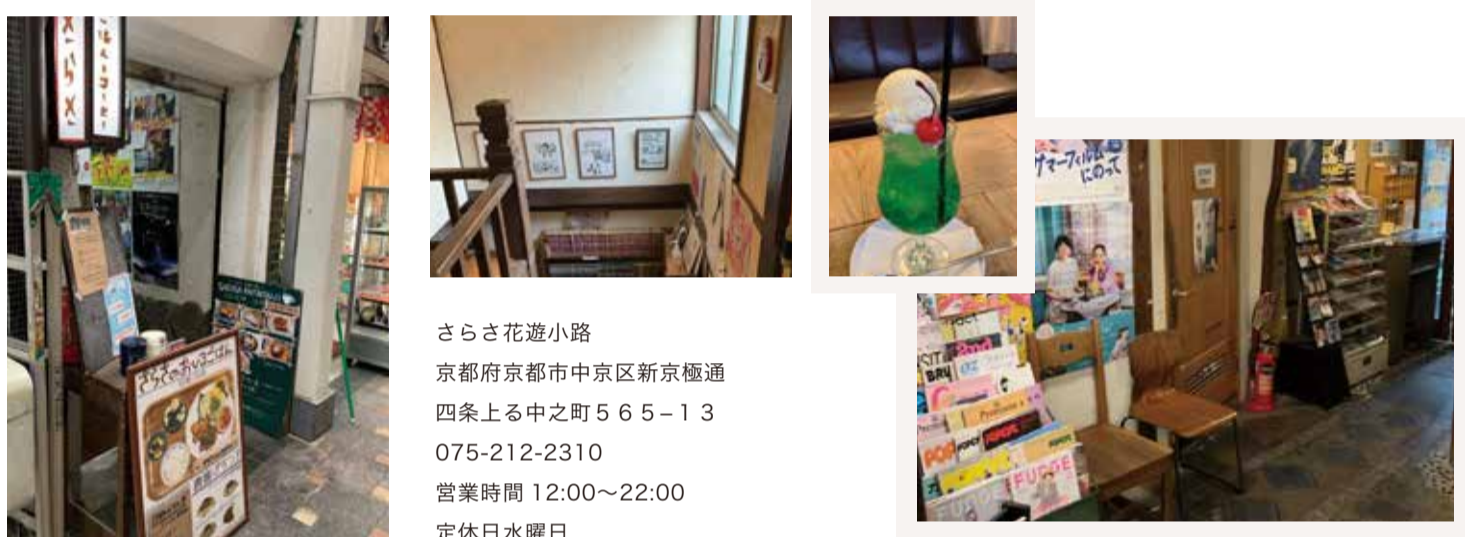
さらさ花遊小路 京都府京都市中京区新京極通 四条上る中之町565-13 075-212-2310 営業時間 12:00~22:00 定休日 水曜日